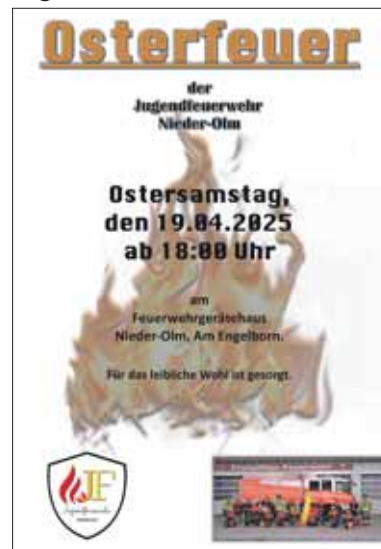
Plakat (kostenpfl.): Ac.S.