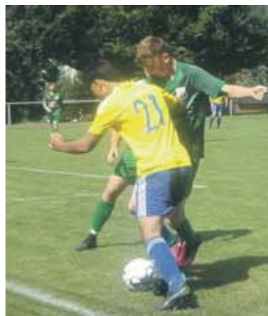
Die „21“ von Framersheim II kann auf eigenem Platz seinen Gegenspieler überlisten.

Die Fußballfreunde in der Region sind schon ganz heiß auf das recht umfangreiche Angebot von spannenden Begegnungen. In der A-Klasse treffen auf der Freimersheimer Sportanlage die beiden Verfolger des führenden Duos Horschheim II / Pfeddersheim II aufeinander. Das Spiel der Gastgeber SG Mauchenheim/Freimersheim gegen Monsheim II wird am Sonntag um 15 Uhr angepfiffen. Zum gleichen Zeitpunkt beginnt in Flonheim die Partie SG Armsheim/Flonheim - TSG Pfeddersheim II. Gespannt sind die Fans natürlich auch auf das Derby SG Weinheim/Heimersheim gegen SG RWO Alzey/TV Lonsheim, das zeitgleich mit den zwei genannten Begegnungen stattfindet. Das trifft auch auf das Spiel SG Nieder-Wiesen/Rheinheissische Schweiz - SV Gimsheim II zu. Nur ein Alzeyer Vertreter muss am 05.10. in die Wormser Region reisen: Das Treffen Pfifflichheim - Framersheim beginnt um 15.15 Uhr. Auch die „Zweite“ der Framersheimer hat ein Auswärtsspiel: Jedoch gerade „um die Ecke rum“! Das Spiel mit Derbycharakter Gau-Heppenheim gegen Framersheim II wird am Sonntag schon um 13 Uhr angepfiffen.