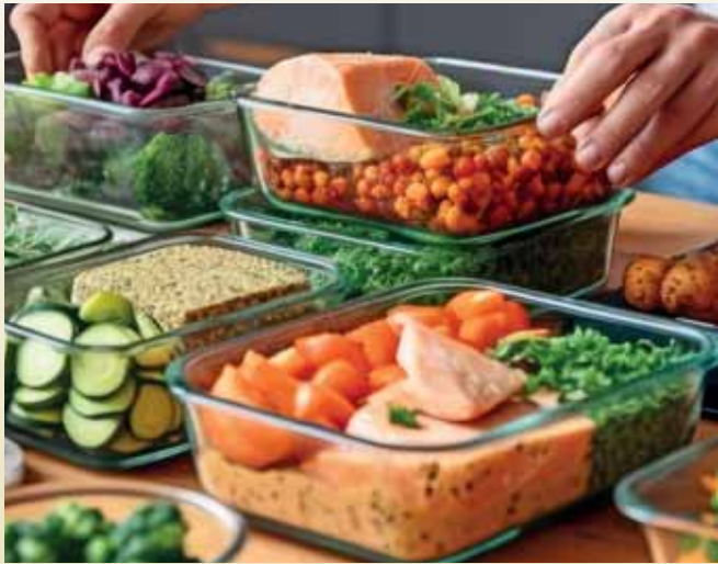
Meal-Prep für die ganze Woche ist ein ambitioniertes Ziel - der tägliche Apfel der erste Mini-Schritt dahin.

Mit kluger Strategie und kleinen Schritten werden sie zur festen Größe im Alltag