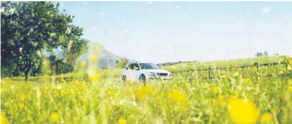
Pollen und weitere Bestandteile der Luft können die Konzentration beim Fahren beeinträchtigen. Ein Innenraumfilter sorgt für saubere Verhältnisse.

Mit einem neuen Innenraumfilter für pollenfreie Luft im Auto sorgen