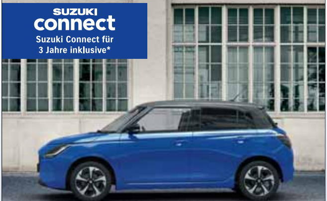
Abbildung zeigt aufpreispflichtige Sonderausstattung.

Für 145 EUR mtl. leasen 1 Swift 1.2 DUALJET HYBRID Club