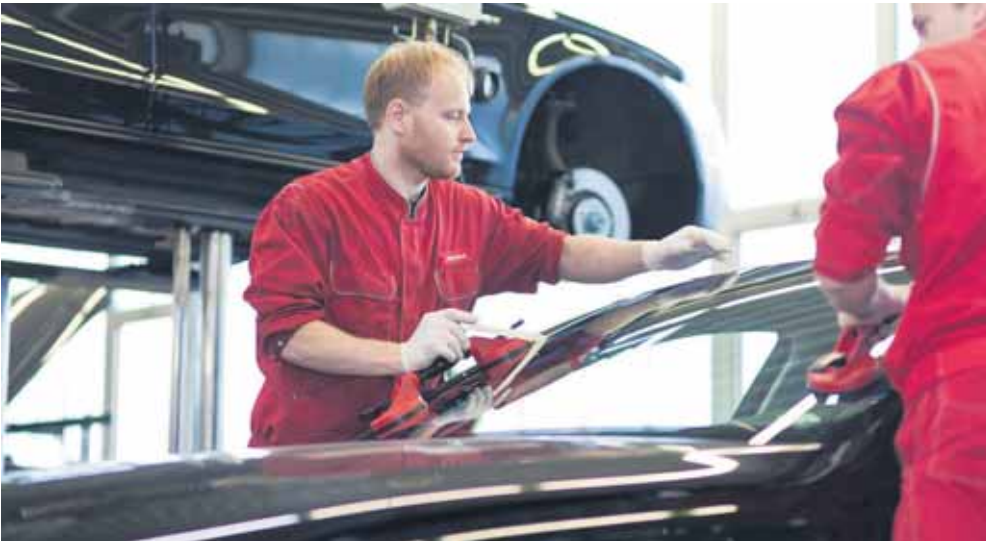
Die Reparatur von Glasschäden sollte in die Hände eines Kfz-Meisterbetriebs gelegt werden, da bei modernen Pkws nach einem Scheibentausch auch Assistenzsysteme neu kalibriert werden müssen.

Eine intakte Frontscheibe ist unverzichtbar für moderne Fahrassistenzsysteme