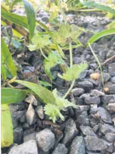
Stängelumfassende Taubnessel – Lamium amplexicaule

als Gemüse (in Verbindung mit Brennnesseln und Giersch), in Wildkräutersalaten, -suppen und -soßen verwendet. Die Blüten können, falls nicht schon bei der Ernte vernascht, als essbare Dekoration genutzt werden.