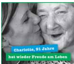
Charlotte, 91 Jahre hat wieder Freude am Leben

GEIS Bestattungen 06130 94 40 84 www.bestattungen-geis.de