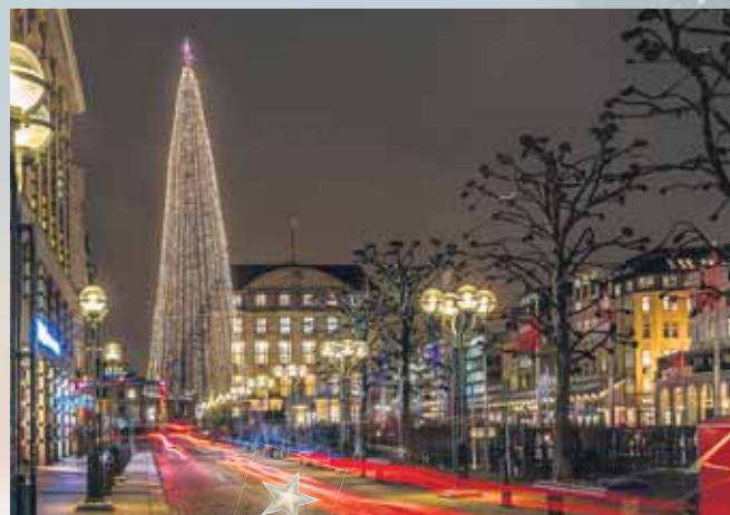
Nicht zuletzt wegen der stimmungsvollen Beleuchtung in den deutschen Städten freuen sich die Menschen auf die Advents- und Weihnachtszeit.

(DJD). Die Weihnachtszeit bringt ein Leuchten in die Städte und privaten Wohnräume: Lichterketten, Sterne und festliche Lampen prägen das Bild und sorgen für eine faszinierende Atmosphäre. Auf diese möchte eine große Mehrheit der Menschen nicht verzichten. Dies bestätigt auch die diesjährige Weihnachtsumfrage, die das Marktforschungsinstitut YouGov im Auftrag des Energieversorgers LichtBlick durchgeführt hat. So bleibt beispielsweise der Wunsch nach öffentlicher Weihnachtsbeleuchtung ungebrochen: 78 Prozent der Befrag-