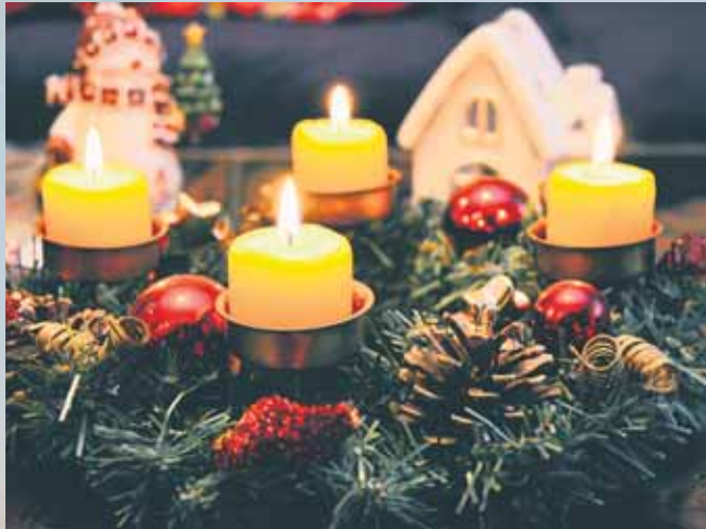
Traditioneller Adventskranz aus Tannengrün mit vier Kerzen – Symbol für die vier Adventssonntage.

1839 baute Johann Hinrich Wichern, ein Hamburger Theologe, für die Kinder seines „Rauhen Hauses“ einen Holzkreuzkranz mit vielen kleinen roten Kerzen und vier großen weißen. Jeden Tag wurde eine rote Kerze entzündet, an jedem Adventssonntag zusätzlich eine weiße. Damit wollte Wichern den Kindern das Warten auf Weihnachten greifbar machen. Im Laufe der Jahre entwickelte sich aus dieser Idee der heute bekannte Kranz mit nur vier Kerzen. Der Ring symbolisiert Ewigkeit, das immergrüne Grün