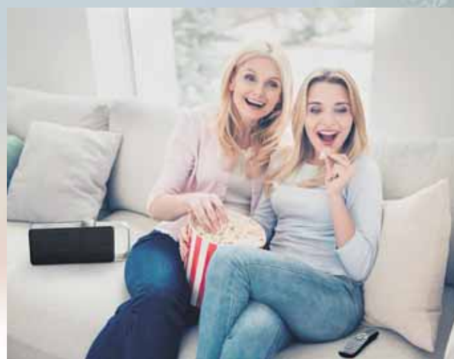
Mehr Freude am Festtagsprogramm: Ein Sprachverstärker sorgt dafür, dass Spielfilmklassiker wieder besser zu verstehen sind.

So groß die Vorfreude auf das Feiertagsprogramm auch ist, so sehr frustriert es gerade ältere Menschen, wenn sie der Handlung nicht immer konzentriert folgen können. Denn während das Bild in hochauflösender Brillanz erstrahlt, lässt der Ton der immer flacheren Fernsehgeräte oft zu wünschen übrig. Viele Dialoge sind nur schlecht zu verstehen. Viele Zuschauer drehen in der Folge die Lautstärke auf – was selten die Verständlichkeit des gesprochenen Wortes verbessert, sondern meist nur die Hintergrundgeräusche verstärkt. Die Familienmitglieder sind zudem genervt, ein gemeinsames, für alle entspanntes Filmerebnis ist so kaum möglich. Technische Hilfsmittel wie der externe Sprachverstärker Oskar können dann eine gute Lösung sein. Das kompakte Zusatzgerät hebt Sprache gezielt hervor und filtert Nebengeräusche aus dem Fernsehton heraus. Die Technik wurde in Zusammenarbeit mit HNO-Ärzten und Hörakustik-Forschern entwickelt und sorgt dafür, dass Dialoge in Filmen und Serien wieder in den Mit-