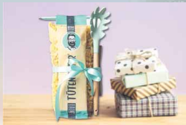
Geschenke, die nicht nur stylisch, sondern auch praktisch sind, kommen immer gut an.

(DJD). Ob für die Freundin, den Bruder oder den Lieblingskollegen: Wir sind immer wieder auf der Suche nach kleinen Geschenken und Aufmerksamkeiten. Doch genau diese Auswahl fällt oft schwer. Es gibt Dinge, die hübsch aussehen - und solche, die man wirklich braucht. Letztere landen nicht in der Schublade, sondern werden häufig und mit Freude benutzt. Darum darf es statt der x-ten Duftkerze oder Tasse gern einmal etwas Praktisches sein, das den Alltag erleichtert und dabei schön anzusehen ist. Schließlich spielen für viele von uns Themen wie Minimalismus, Nachhaltigkeit und ein bewusster Umgang mit Dingen eine immer größere Rolle.