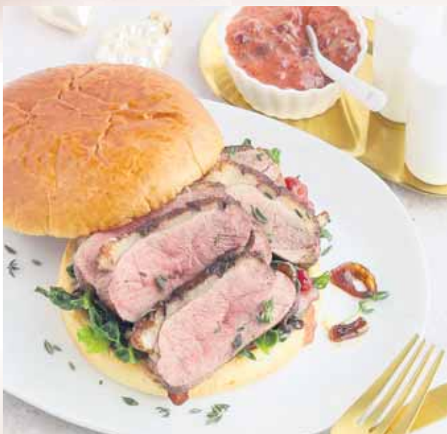
Zu Weihnachten mal was anderes als den traditionellen Festtagsbraten: einen leckeren X-mas-Burger mit Putenfilet.

Einfach lecker: Burger mit Hähnchen, Pute und Co.