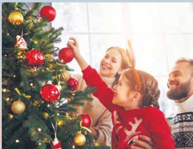
Sicher stehen sollte der Christbaum, damit man ihn mit allerlei festlicher Dekoration zum Funkeln bringen kann.

So gelingt das Fest – mit Tipps für Einkauf, Befestigung, Frische und Schmuck