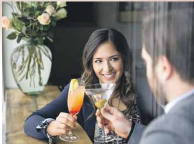
Mit feinen Spirituosen und kreativen Cocktails erhalten Feiertage einen besonderen Rahmen.

RHEINHESSEN AUTOGLAS GbR Mitsche & Symonowicz Öffnungszeiten: Mo. bis Fr. 8:00 bis 17:00 Uhr · Samstag n. V. Am Hahnenbusch 21 · 55268 Nieder-Olm · Tel. 06136 798 82 38