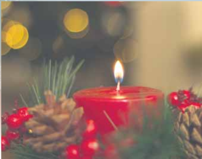
Kerzenlicht & Besinnung – ein Moment der Ruhe im Advent.

(sp-o) Advent ist eine Zeit, in der Rituale, Musik und Gemeinschaft wichtig sind. Für viele Menschen geben sie Struktur, Wärme und Tiefe in einer oft hektischen Zeit.