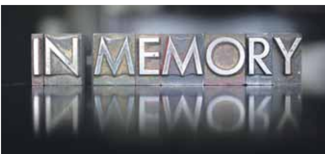
Lobinski, Swetlana Wall, Mühlbauer, eyetronic, enterlinedesign_adobestock