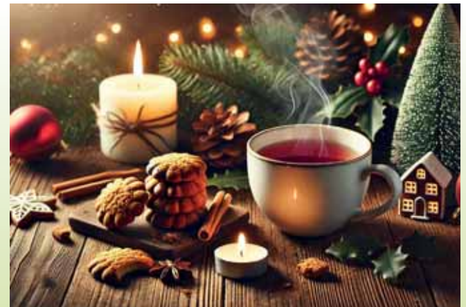
Adventsmomente bewusst genießen – Tee und Plätzchen bringen Ruhe in den Alltag.