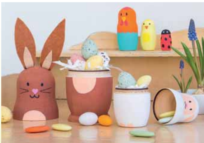
Überraschung: Aus manchen Osterhasen kommen Eier, aus anderen schlüpft ein Lamm, ein Huhn, ein Küken, ein Marienkäfer.

Niedliche Figuren mit Überraschungseffekt – ganz einfach selbst gemacht