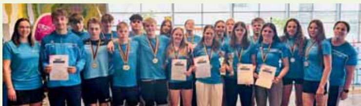
Erfolgreiche Sportler bei den Landesmeisterschaften im Rettungssport

Mit beeindruckenden Leistungen kehrte die DLRG Nieder-Olm/Wörrstadt von den Landesmeisterschaften im Rettungsschwimmen in Trier zurück. Die Nachwuchssportler/-innen der Ortsgruppe bewiesen einmal mehr ihr großes Können und gehören damit zu den erfolgreichsten Vereinen im Land. Besonders erfreulich: Gleich 5 neue Landesmeistertitel gingen an Athlet(inn)en der DLRG Nieder-Olm/Wörrstadt. Auch in den Mannschaftswettbewerben zeigte sich die Stärke der Ortsgruppe. Insgesamt 4 Mannschaften sicherten sich den Titel des Landesmeisters und damit gleichzeitig die Qualifikation für die Deutschen Meisterschaften, die im November in München ausgetragen werden. Die Vorfreude auf das nationale Saisonhighlight ist bei den Kindern und Jugendlichen bereits riesengroß. Schließlich finden die Wettkämpfe in der traditionsreichen Olympia-Schwimmhalle statt – für viele Nachwuchsrettungsschwimmer ein ganz besonderes Erlebnis und die Erfüllung eines kleinen Traums.