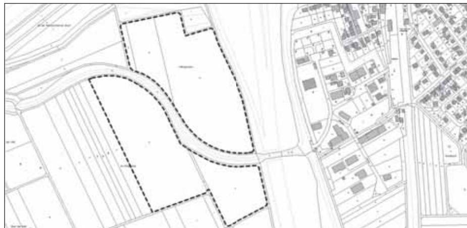
gez. Wilfried Best Ortsbürgermeister

Darstellung des räumlichen Geltungsbereichs (schwarz gestrichelt; nicht maßstabsgetreu). Albig, den 03.02.2026