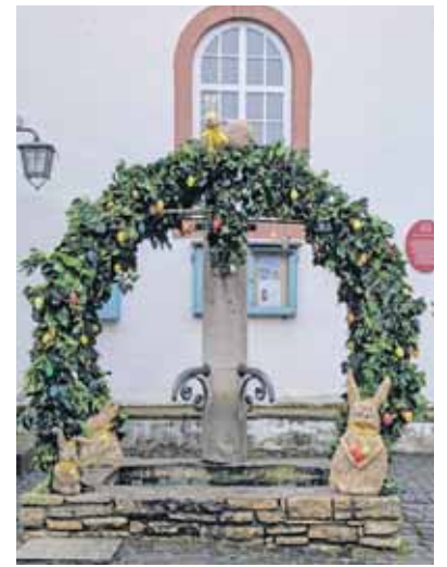
Heike Baumann, 1. Beigeordnete (Text/Foto)

Am 28.03. wurde bei Regen und winterlichen Temperaturen der Osterbrunnen am Rathaus geschmückt. Geschützt durch einen Pavillon und mit gesponsertem Glühwein zum Wärmen von innen wurde mit guter Laune dem Wetter getrotzt. Das mittlerweile eingespielte Team hat wieder für wunderbare österliche Stimmung in Flornborn gesorgt. Vielen Dank an alle Helfer und Unterstützer.