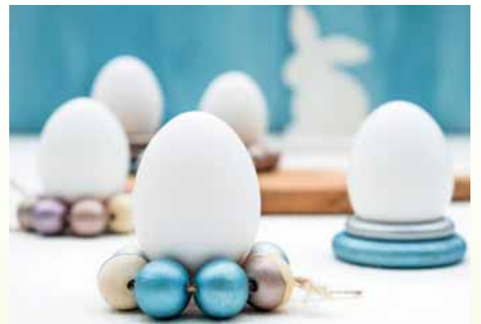
Selbstgemachte Eierbecher mit Perlmutt-Effekt sorgen bereits am Frühstückstisch für festliche Osterstimmung.

txn. Eierbecher aus Holzkugeln? Wer über etwas Kreativität, Muße und die richtigen Materialien verfügt, kann damit Familie und Freunden zum Osterfest eine Freude machen. Benötigt werden Holzkugeln mit einem