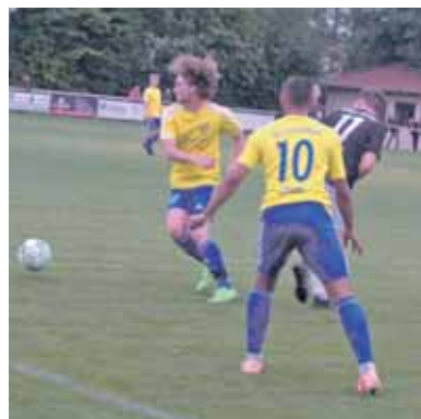
Das Framersheimer Duo kann hier die Nr. 11 der Gäste „abmelden“.

Ein heißes Fußball-Duell! In der Framersheimer Arena wird am kommenden Sonntag sicherlich „richtig was los“