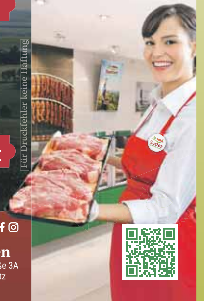
Für Druckfehler keine Haftung!