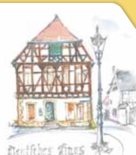
Deutsches Haus in Gau-Odernheim Zeichnung Erhard Hiltz