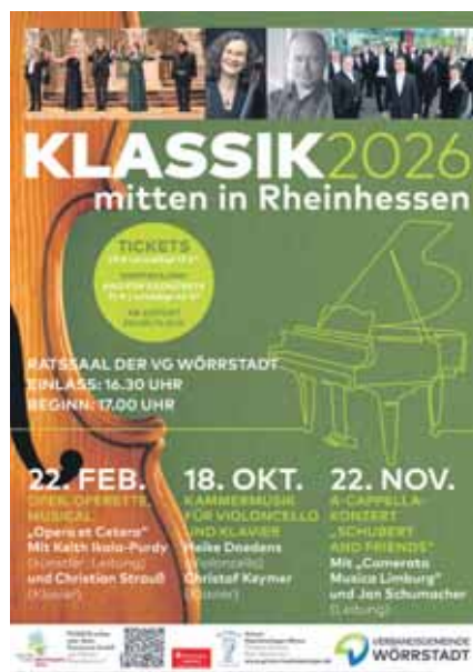
Plakat: VG Wörrstadt

Die Verbandsgemeinde Wörrstadt und ihre Partner freuen sich sehr, dass die Konzertreihe KLASSIK mitten in Rheinhessen im Jahr 2026 fortgesetzt wird. Die Konzerte finden in diesem Jahr erstmals im Ratsaal der Verbandsgemeinde Wörrstadt statt – wie gewohnt sonntags um 17 Uhr, der Einlass beginnt um 16.30 Uhr.