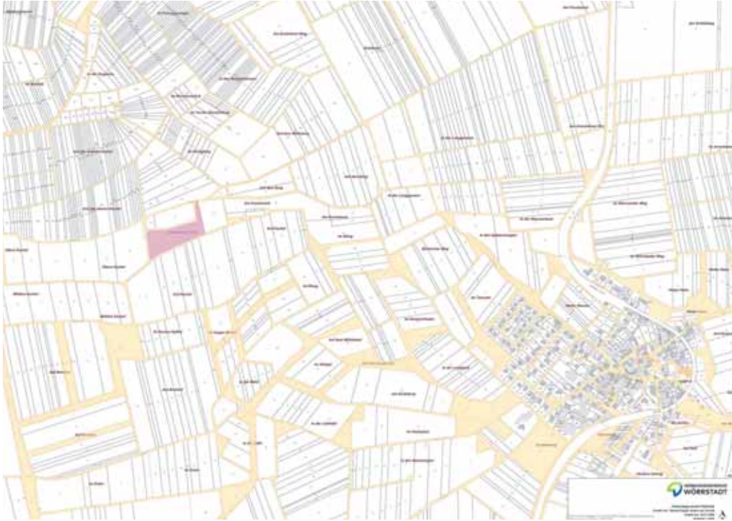
Karte: VG Wörrstadt

Ensheim bekommt etwas Besonderes: einen kleinen Wald. In Rheinhessen ist das alles andere als selbstverständlich, denn unsere Landschaft ist traditionell von Weinbergen und offenen Flächen geprägt. Umso mehr freue ich mich, dass nun im Außenbereich unserer Gemarkung eine neue Waldfläche entsteht. Gemeinsam mit der Schutzgemeinschaft Deutscher Wald wird eine Fläche aufgeforstet und mit standortgerechten Bäumen und Sträuchern bepflanzt. Damit leisten wir einen wichtigen Beitrag für Natur- und Klimaschutz sowie für mehr Biodiversität in und um Ensheim. Das Projekt ist zugleich ein Baustein im Rahmen des Integrierten Ländlichen Entwicklungskonzepts (ILEK) und steht damit für eine nachhaltige Entwicklung unserer Gemeinde.