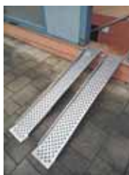
Alu-Auffahrschienen neu, ungebraucht, 80,- €, Tragkraft 400 kg, ☎ 06732 2248

Saulheim. Traditionelles Schlachtfest auf dem Landgrafenhof 27.02. + 28.02.2026 jeweils ab 18:30 Uhr. Weitere Infos unter www.weingut-landgrafenhof.de . Reservierungen und Tickets ab sofort möglich per E-Mail an: info@weingut-landgrafenhof.de oder unter ☎ 06732 962035 Weingut Landgrafenhof, Ausserhalb 8, 55291 Saulheim (gew.)