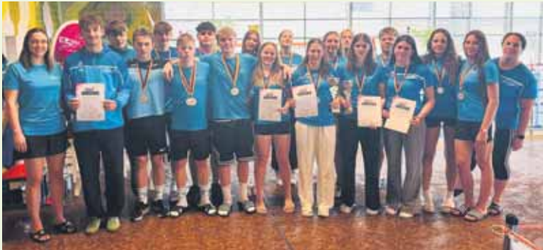
Erfolgreiche Sportler bei den Landesmeisterschaften im Rettungssport

Mit beeindruckenden Leistungen kehrte die DLRG Nieder-Olm/Wörrstadt von den Landesmeisterschaften im Rettungsschwimmen in Trier zurück. Die Nachwuchssportler/-innen der Ortsgruppe bewiesen einmal mehr ihr großes Können und gehören damit zu den erfolgreichsten Vereinen im Land. Besonders erfreulich: Gleich 5 neue Landesmeistertitel gingen an Athlet(inn)en der DLRG Nieder-Olm/Wörrstadt. Auch in den Mannschaftswettbewerben zeigte sich die Stärke der Ortsgruppe. Insgesamt 4 Mannschaften sicherten sich den Titel des Landesmeisters und damit gleichzeitig die Qualifikation für die Deutschen Meisterschaften, die im November in München ausgetragen werden. Die Vorfreude auf das nationale Saisonhighlight ist bei den Kindern und Jugendlichen bereits riesengroß. Schließlich finden die Wettkämpfe in der traditionsreichen Olympia-Schwimmhalle statt – für viele Nachwuchsrettungsschwimmer ein ganz besonderes Erlebnis und die Erfüllung eines kleinen Traums.